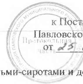
График проведения обследований жилых помещений, сохраненных за детьми-сиротами и детьми, оставшимися без попечения родителей на 2020 год